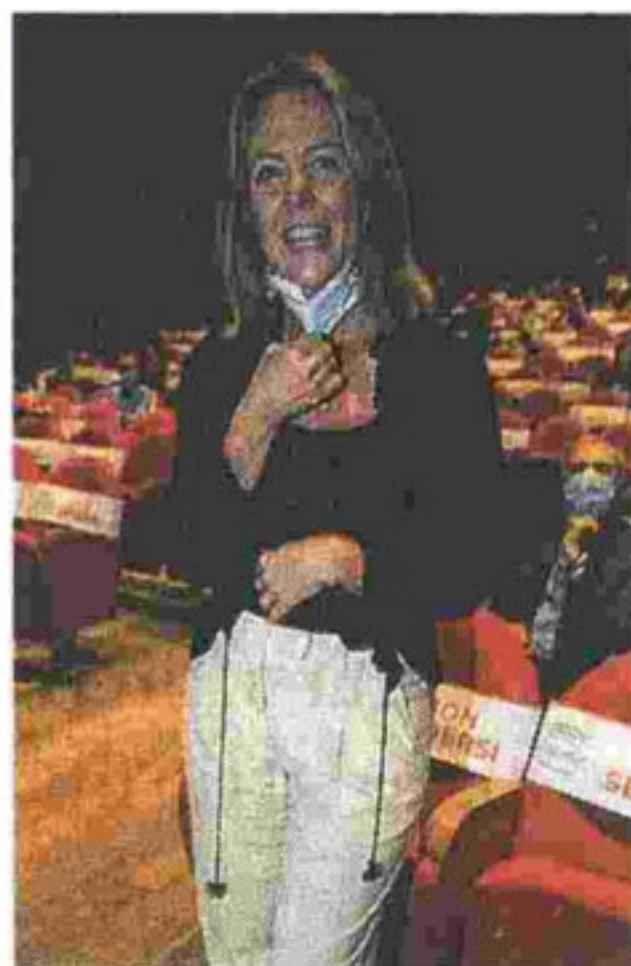
Ex ministra della Salute Beatrice Lorenzin