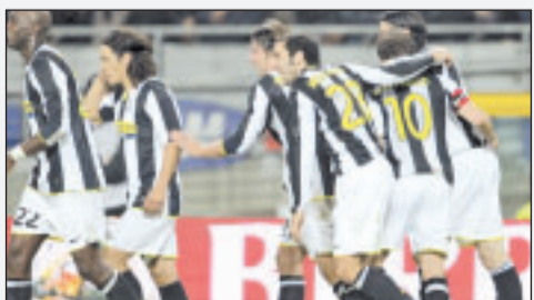
Festa a la quinta dopo il gol del 3-0