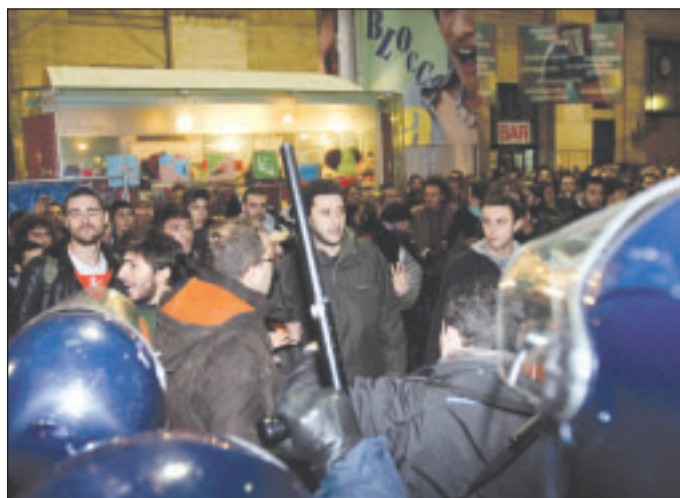
Studenti alla stazione pronti a partire per Roma