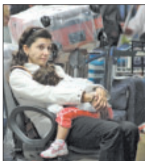
Passeggeri a Fiumicino