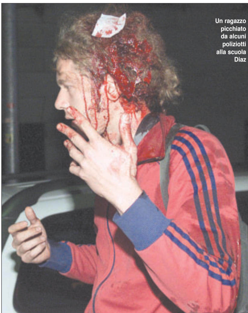
Un ragazzo picchiato da alcuni poliziotti alla scuola Diaz